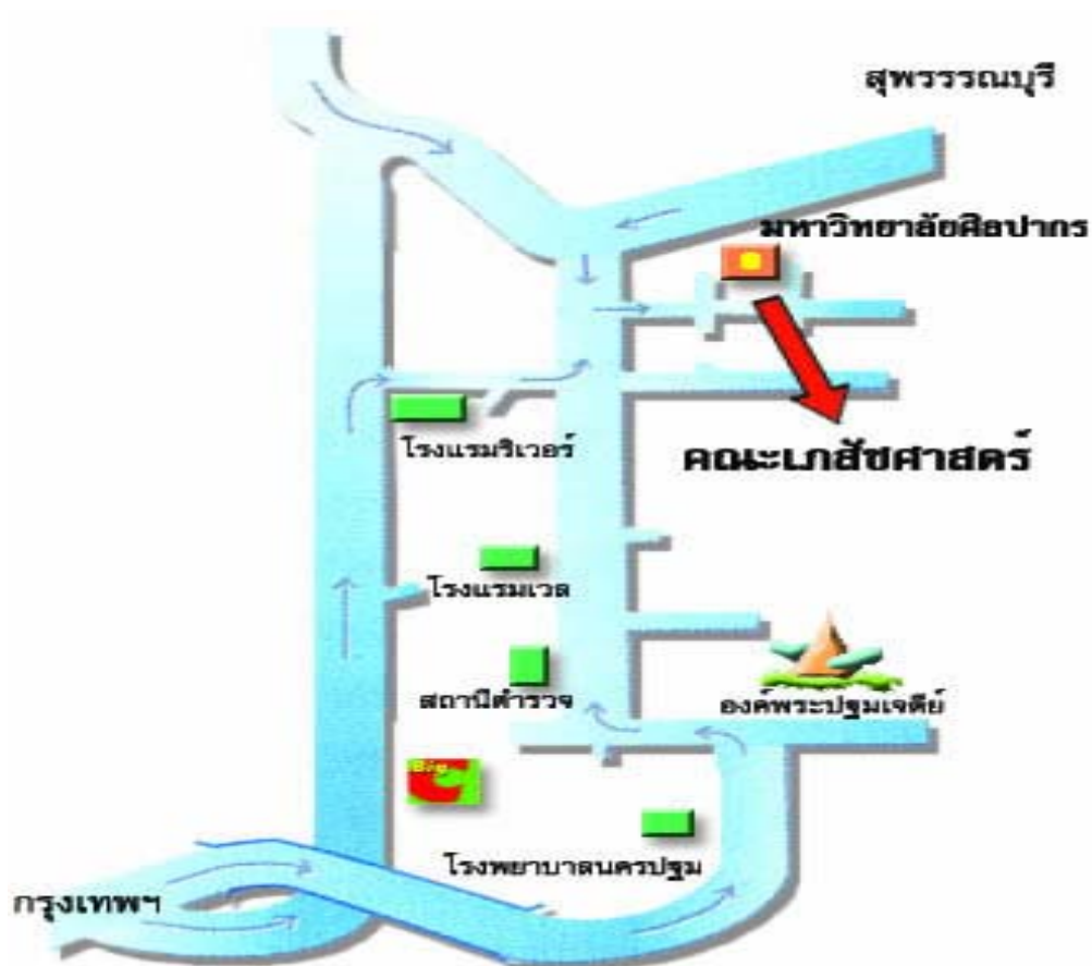
แผนที่การเดินทางเส้นทางภายนอกคณะเภสัชศาสตร์